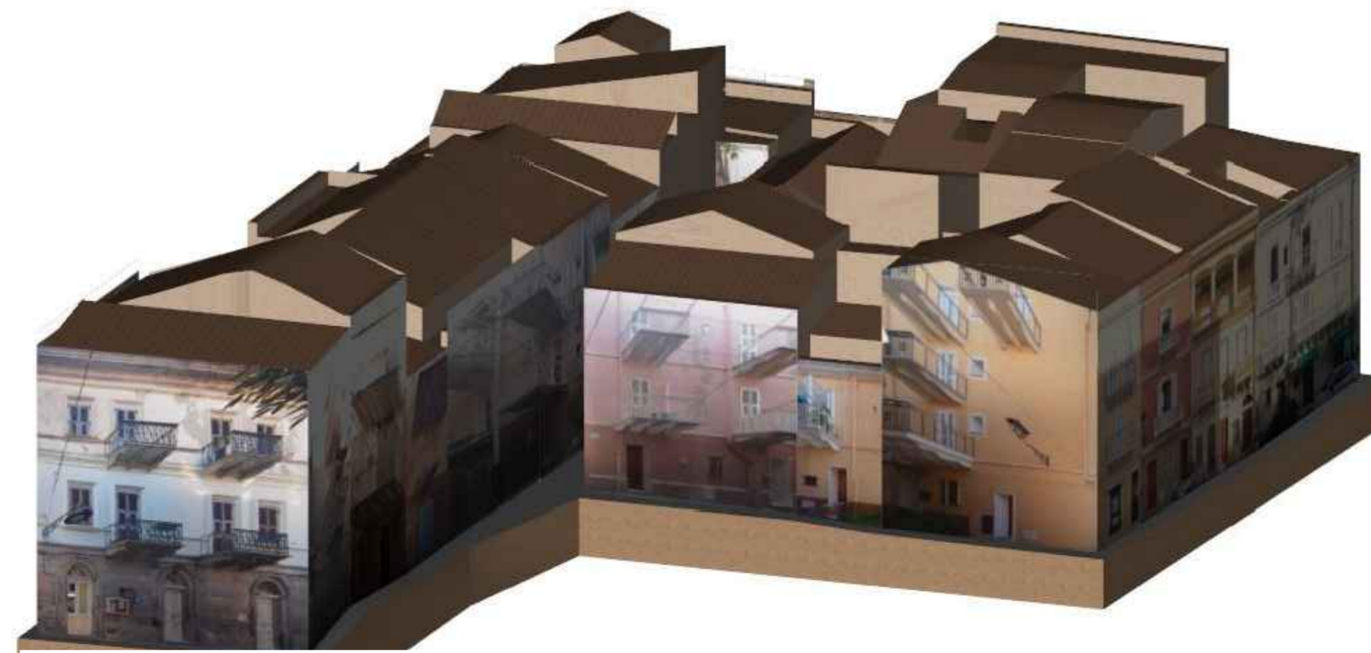
VISTA ASSONOMETRICA 6