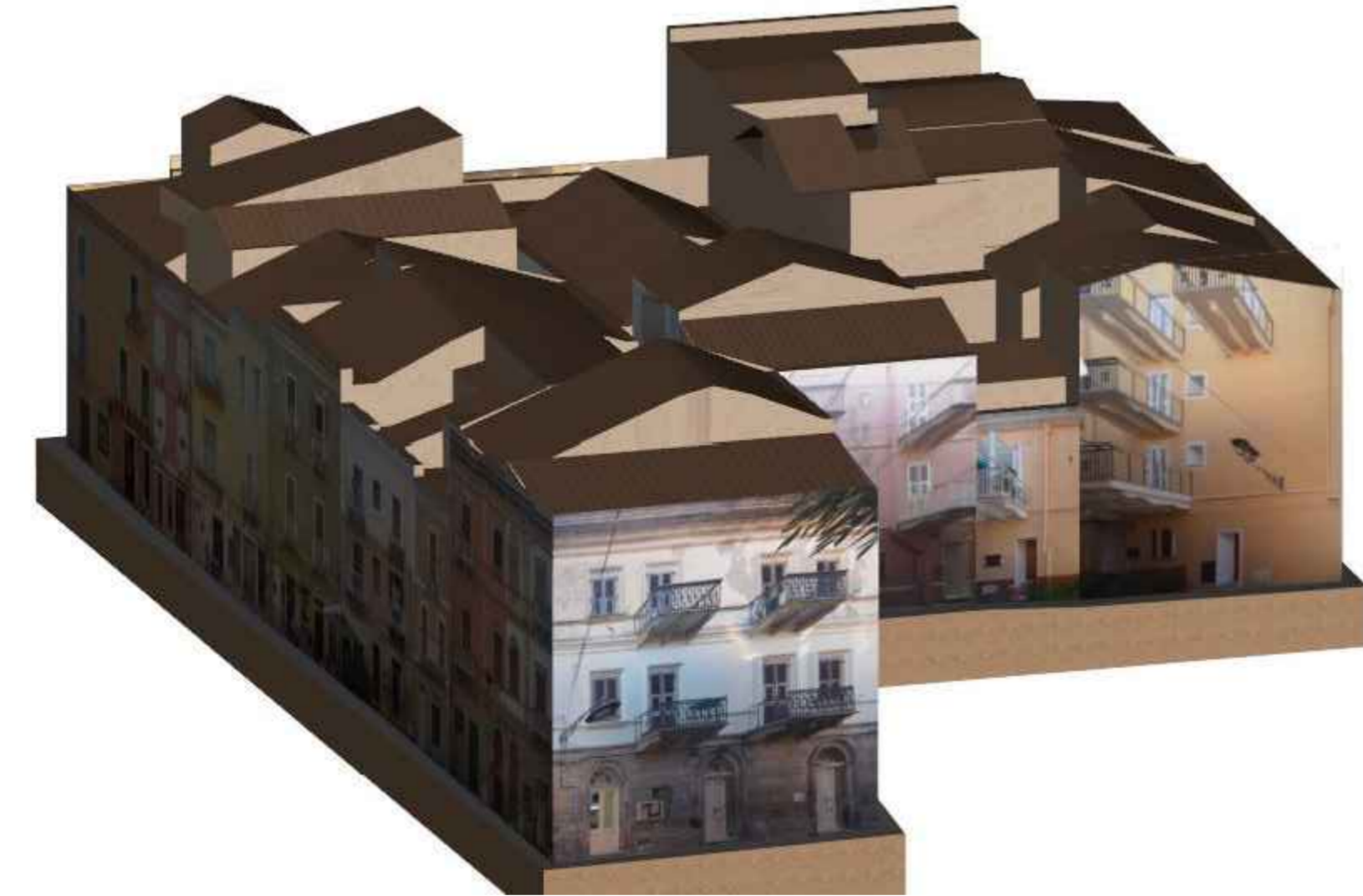
VISTA ASSONOMETRICA 5