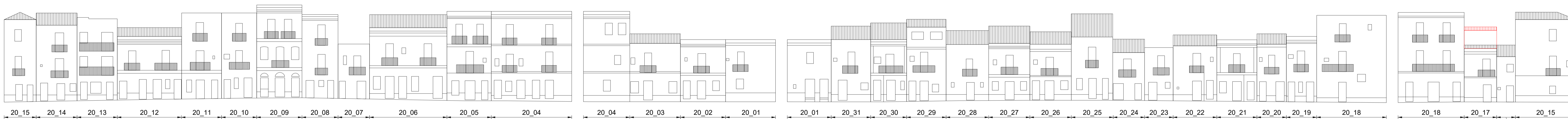
VIA GIACOMO MATTEOTTI