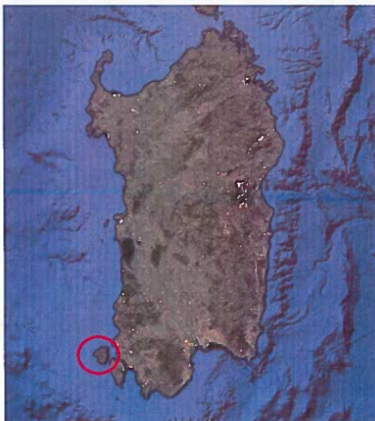
Fig. 1: Inquadramento Territoriale Isola di San Pietro

Il Comune di Carloforte è oggetto del servizio di trasporto e raccolta dei Rifiuti solidi urbani, affidato a partire dal 01/07/2019 alla società Teknoservice srl, la quale opera in tutto il territorio dell'Isola di San Pietro, con modalità porta a porta, per una superficie complessiva di 51 kmq (vedi Fig. 1).